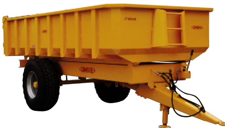
RB 10 MTP