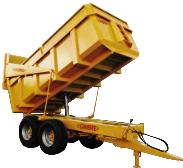
RBB 10 M