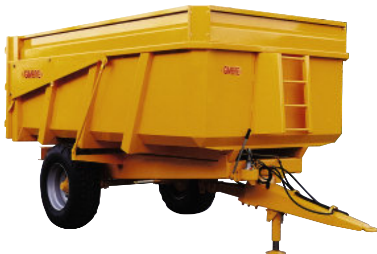
RB 8 M