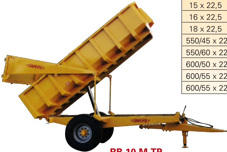
RB 10 M TP