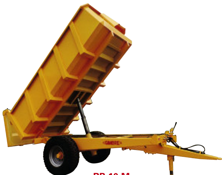
RB 10 M