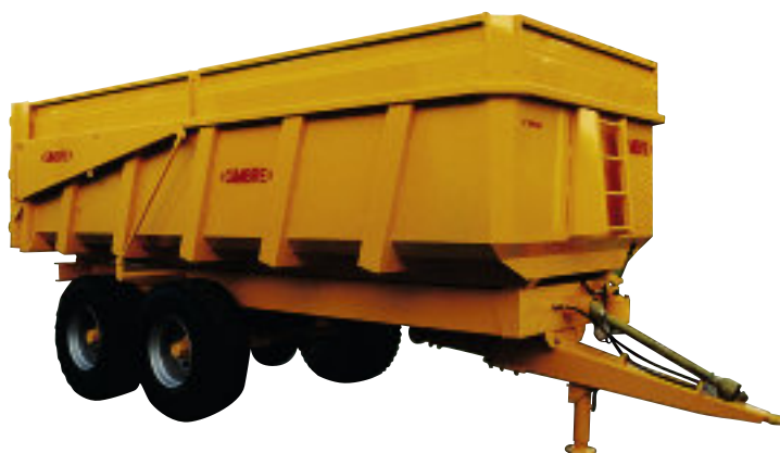
RBB 12 M