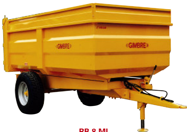
RB 8 ML